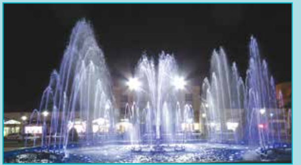
اجرای آبنمای رینمی در میدان کوثر