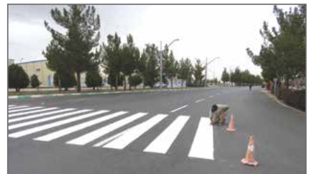
خط کشی معابر سطح شهر