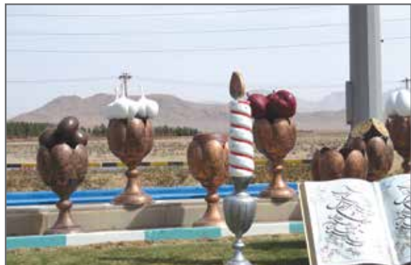
نصب المان سفره هفت سین در ورودی شهر