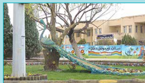
نگوسازی میدان شهداء (میدان بی تا)