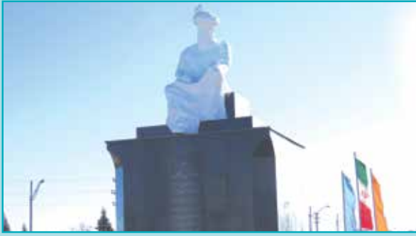
برگزاری آئین برده برداری از تندیس علامه مجلسی