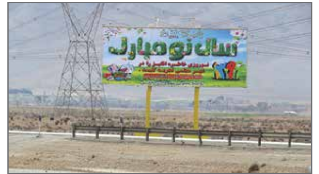
نصب بیلبوردهای تبریک سال جدید