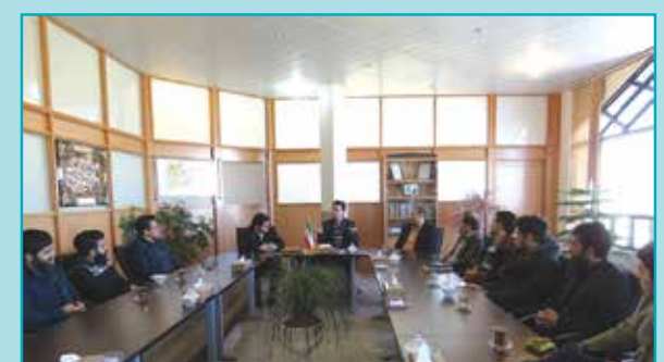
دیدار تعدادی از جوانان شهر با شهردار مجلسی