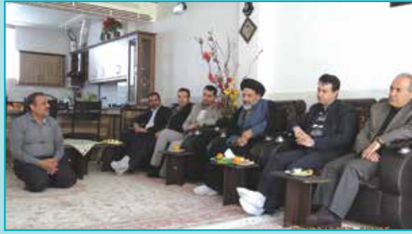
دیدار با خانواده معظم شهداء