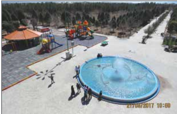
نصب آب نمای ریتمیک در پارک ارم