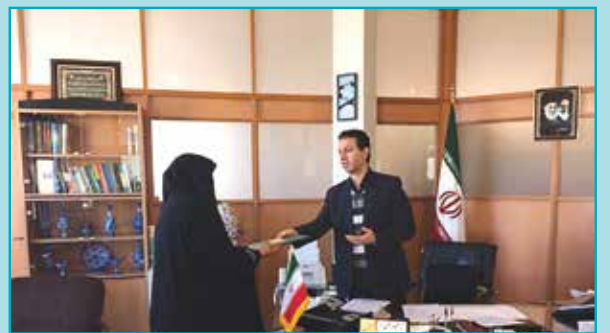
تقدیر از مأمور سرشماری عمومی نفوس و مسکن سال ۱۳۹۵ شهر مجلسی