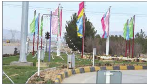
نصب پرچم های رنگی