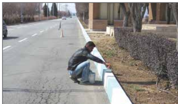
رنگ آمیزی جداول سطح شهر