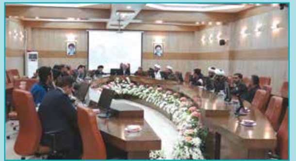
تشکیل جلسه ستاد احیاء امر به معروف و نهی از منکر شهرستان