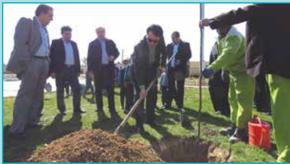
مراسم روز درختکاری