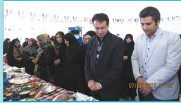
برگزاری جشنواره غذاهای سنتی و سالم در دهه فجر