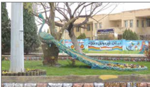
نصب المان طاووس در میدان شهدا