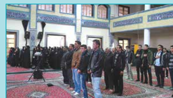
همایش ۹ دی