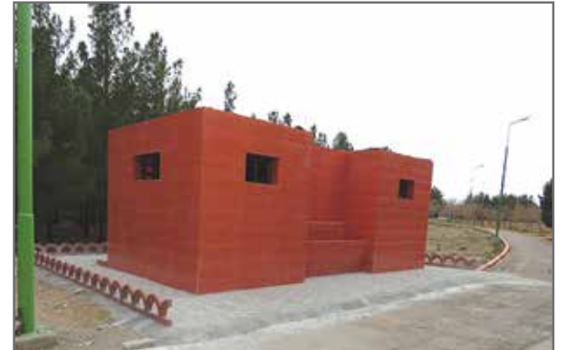
بازسازی سرویس بهداشتی پارک ارم