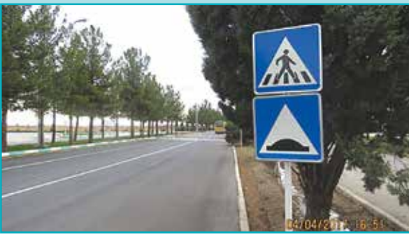
اجرای گاهنده سرعت و خط کشی عابر در معابر شهری