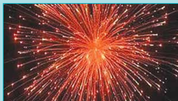
نور افشانی آسمان شهر