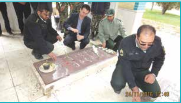
غبار رویی و گلباران مزار مطهر شهداء