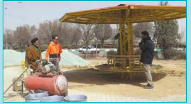
بازدید از اقدامات نوروزی شهرداری