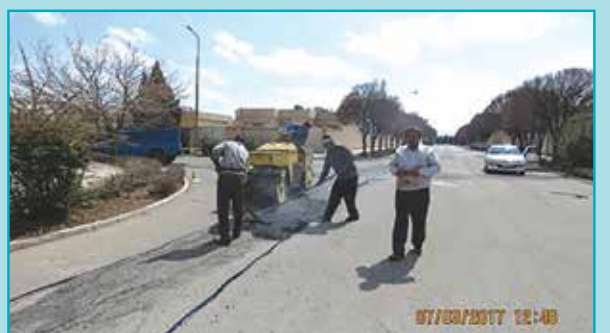
ادامه عملیات ترمیم و لکه گیری آسفالت معابر