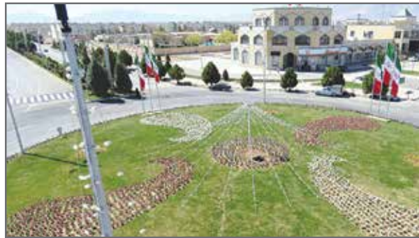
گل کاری و ریسه کشی میدان کوثر