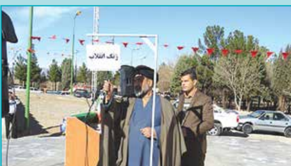
نواختن زنگ انقلاب و آغاز دهه فجر