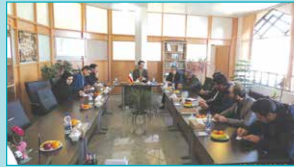
تشکیل جلسه ستاد ساماندهی امور جوانان