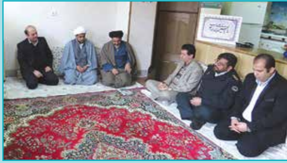
دیدار با امام جمعه محترم شهر مجلسی