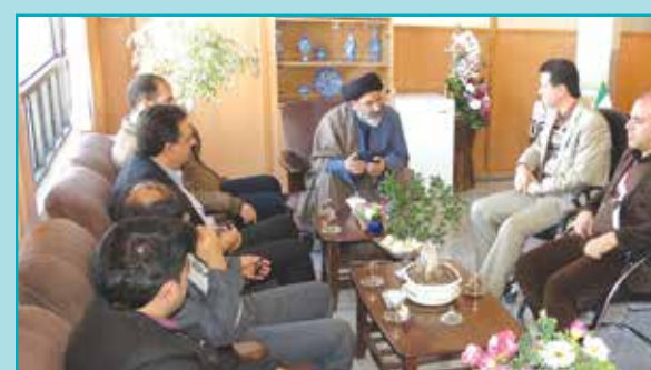
دیدار مسئولین شهر با شهردار مجلسی