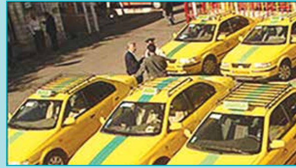
برقراری خطوط ویژه تاکسی