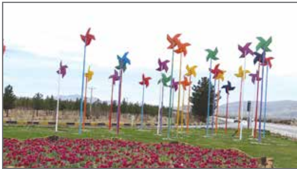
گل کاری و ریسه کشی میدان ورودی شهر

اجرای اقدامات لازم جهت بهبود وضعیت بوستان های شهر تعمیر سرویس های بهداشتی، راه اندازی آب نماها، افزایش سطوح گلکاری شده، رنگ آمیزی مبلمان شهری و تجهیزات و نصب المانهای نوروزی