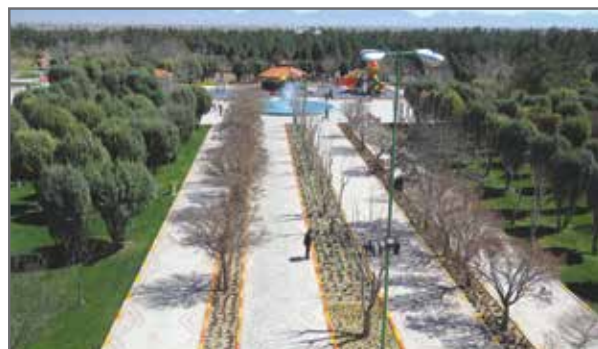
رنگ آمیزی جداول پارک ارم