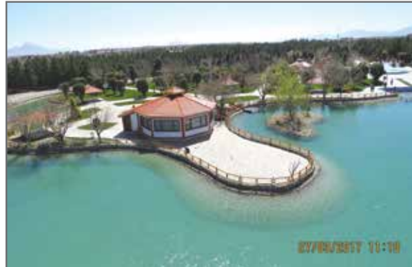
احیا و بازسازی محیط و دریاچه پارک ارم