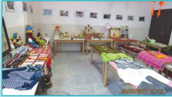
برگزاری نمایشگاه صنایع دستی و هنری در دهه فجر