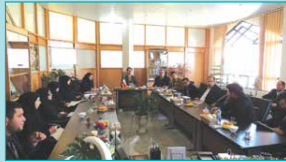
تشکیل دومین جلسه ستاد فرعی دهه فجر