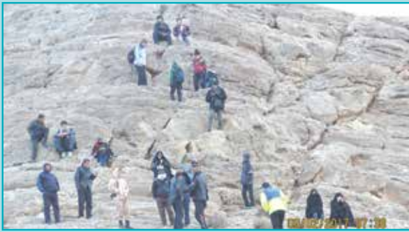
همایش کوهگشت خانوادگی به مناسبت دهه فجر