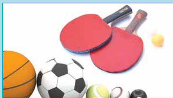
توزیع رایگان وسایل ورزشی در مدارس شهر