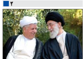
۵۹ سال همکاری و همدلی