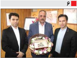
رونمایی از هدیه معنوی سه برادر افسانه‌ای کارانه لنجان در شهرداری زرین شهر