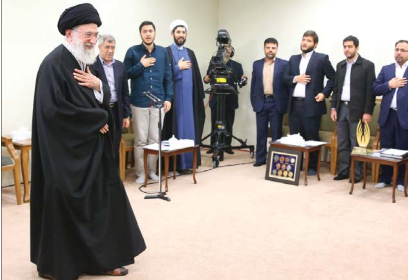
رهبر معظم انقلاب اسلامی در دیدار نخبگان و دانشجویان بسیجی مدال آور دانشگاه شریف: