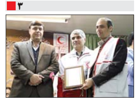
در همایش تجلیل از خیران و دیپلماتان شهرستان مبارکه انجام شد؛ قدرانی از اقدامات خیرخواهانه شرکت فولاد مبارکه