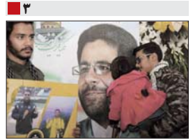
به میزبانی فولاد مبارکه انجام شد. برگزاری مراسم باشکوه بزرگداشت خبرنگار شهید محسن خزایی در اصفهان