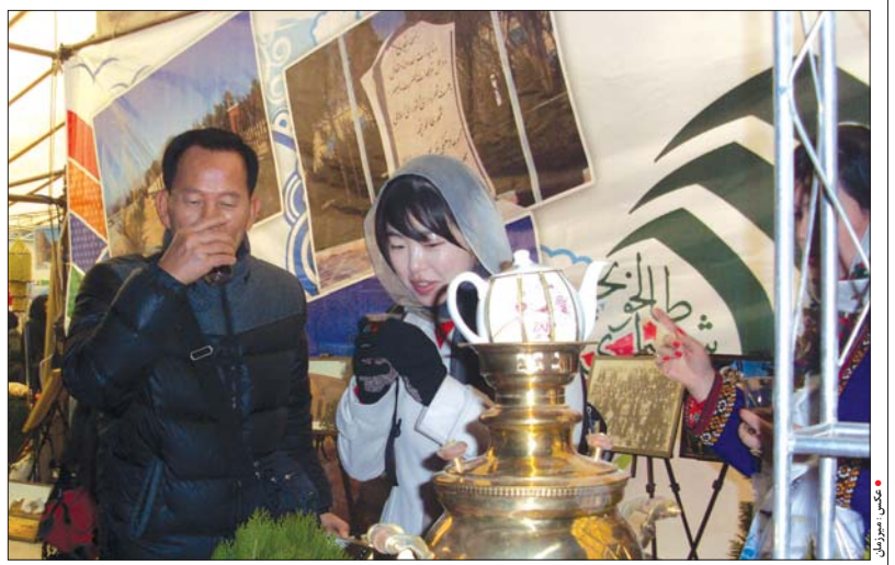
شهر طالخنونچه دیار هزار ساله صاحب ابن عباد با درخشش در جشنواره سفره ایرانی، فرهنگ گردشگری