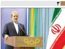
معاون اول رئیس جمهور: فولاد مبارکه نماد صنعت ایران است