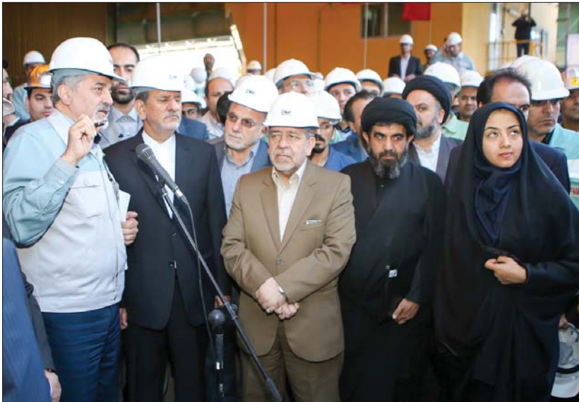
در آیین بهره برداری از ماشین ریزخته گری شماره ۵ شرکت فولاد مبارکه مطرح شد