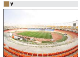
افتتاح ورزشگاه نقش جهان اصفهان یابانی خوش بر انتظار ۲۳ ساله