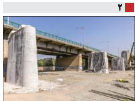
روایتی از «اقدام و عمل» در اصفهان: فعالیت ۳۵ پروژه میلیاردی در شهر