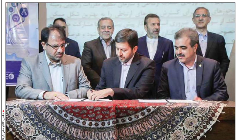
با حضور وزیر ارتباطات و فناوری اطلاعات: تفاهم نامه توسعه زیرساخت های فیبر نوری شهر اصفهان به امضا رسید