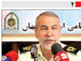
اجرای طرح بزرگ برخورد با کانون های جرم در اصفهان ۵۰۰میلیارد تالی قاچاق در پنج ماهه اول امسال

رهبر انقلاب در دیدار آتمه جماعات مساجد استان تهران: به یکی از سران فتنه گفتیم شما ظاهرا با نظام هستید اما مدیریت به دست پیگلگان می افتد