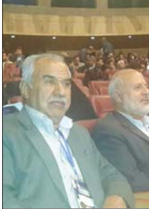
تفاهم نامه سرمایه گذاری به ارزش ۶۲۰ تریلیون ریال و میزان ۲ برابر بودجه عمرانی کشور، ضرورت عملیاتی و اجرایی شدن آنها، کمیته دائمی پیگیری تفاهم نامه در زیر مجموعه دبیرخانه دائمی اجلاس جهانی شهرداران...