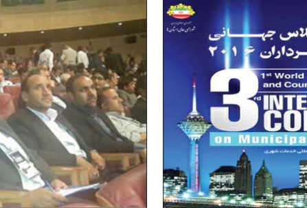
تفاهم نامه سرمایه گذاری به ارزش ۶۲۰ تریلیون ریال و میزان ۲ برابر بودجه عمرانی کشور، ضرورت عملیاتی و اجرایی شدن آنها، کمیته دائمی پیگیری تفاهم نامه در زیر مجموعه دبیرخانه دائمی اجلاس جهانی شهرداران...