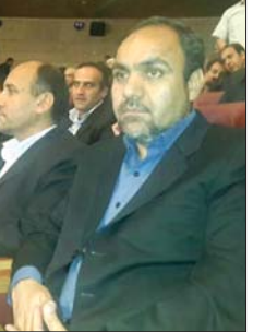
تفاهم نامه سرمایه گذاری به ارزش ۶۲۰ تریلیون ریال و میزان ۲ برابر بودجه عمرانی کشور، ضرورت عملیاتی و اجرایی شدن آنها، کمیته دائمی پیگیری تفاهم نامه در زیر مجموعه دبیرخانه دائمی اجلاس جهانی شهرداران...