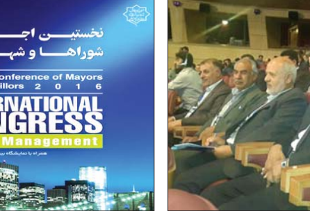
تفاهم نامه سرمایه گذاری به ارزش ۶۲۰ تریلیون ریال و میزان ۲ برابر بودجه عمرانی کشور، ضرورت عملیاتی و اجرایی شدن آنها، کمیته دائمی پیگیری تفاهم نامه در زیر مجموعه دبیرخانه دائمی اجلاس جهانی شهرداران...