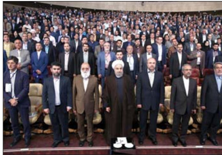
زمانی پیرامون محورهای اجلاس جهانی شهرداران ۲۰۱۶ گفت: ستاد برگزاری اجلاس جهانی شهرداران با توجه به اهمیت موضوع مدیریت شهری و نقش مؤثر آن در توسعه نظام شهری و شهرداری...