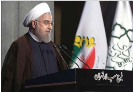
زمانی پیرامون محورهای اجلاس جهانی شهرداران ۲۰۱۶ گفت: ستاد برگزاری اجلاس جهانی شهرداران با توجه به اهمیت موضوع مدیریت شهری و نقش مؤثر آن در توسعه نظام شهری و شهرداری...