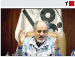
نامه مدیرعامل فولاد مبارکه به قاضی پور سبحانی حقوق ۱۹۶ برابری خود را تکذیب کرد + اسناد