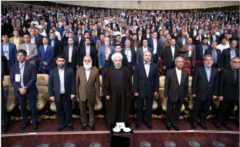
شهردار و شورای اسلامی دیزجچه در اجلاس جهانی شوراها و شهرداران ۲۰۱۶