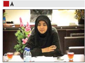
نماینده مردم مبارکه خبر داد: بررسی وضعیت بازنشستگان فولاد و ذوب آهن در کمیسیون اقتصادی مجلس