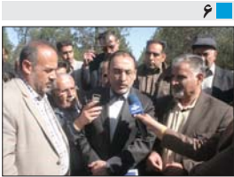
چهار پروژه شهرداری زمین شهر با اعتبار ۲۲۰ میلیارد ریال بهره برداری و کلنگ زنی شد