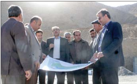
پروژه جایگاه سوخت CNG اعتبار پروژه: ۱۰۰۰۰۰۰۰ ریال مدت زمان اجرای پروژه: ۱۹ ماه مشخصات فنی پروژه: - اجرائی میدان به شعاع ۳۰ متر شامل ۱۶۰۰۰ متر مکعب خاکبرداری - ۵۰۰ متر طول جدول گذاری - ۲۵۰۰ متر مربع آسفالت - هدف از اجرای پروژه: تسهیل در عبور و مرور و مسأله تقلب و ایمنی بیشتر در بلوار جانبازان و دسترسی به بلوار علامه طباطبائی و نیز دسترسی به کمربندی شمال غرب زرین شهر و جاده اصفهان - شهرکرد