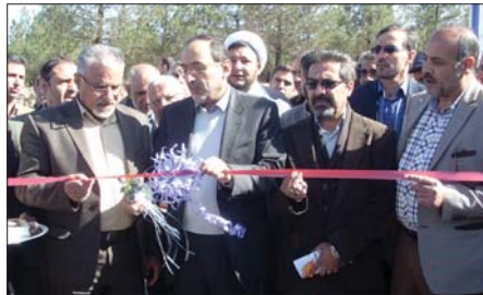
تاثیرگذار خواهد بود. میدان پردیس به صورت دایره طراحی شده و دارای قطر داخلی حدود ۱۰۰ متر و قطر خارجی حدود ۱۳۳ متر می باشد. شاهه های ورودی به میدان عبارتند از: ۱) دو شاهه ورودی با دو لاین سه بانده با ورودی وسط به عرض ۶ متر ۲) شاهه ورودی دو بانده با ورودی وسط به عرض ۴ متر اعتبار پیش بینی شده: ۱۰۰۰۰۰۰۰ ریال اهداد احداث میدان علامه طباطبائی اعتبار پروژه: ۶۵ میلیارد ریال