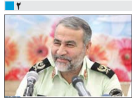
سردار آقاخانی خبر داد: تأمین امنیت مسافران نوروزی با ۲ هزار نیروی پلیس اصفهان

افتتاح چند زیرساخت مهم گردشگری در آستانه نوروز ۹۵