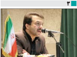
دادستان عمومی و انقلاب شهرستان مبارکه : دستگاه قضایی مبارکه با تخلفات انتخاباتی برخورد قاطع می کند