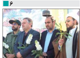
آیین با شکوه زنگ انقلاب، گلباران تمثال امام(ره) و غبارویی امامزاده سلیمان و دیروزچه برگزار شد