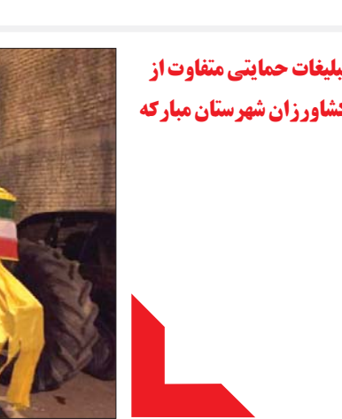
تبلیغات حمایتی متفاوت از کشاورزان شهرستان مبارکه