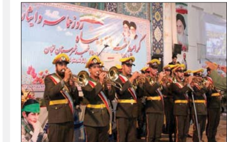
روزنامه‌های «روزنامه‌های ایران» و «روزنامه‌های تهران» در مراسم روز حماسه و ایثار