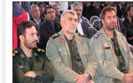
با حضور امام جمعه، معاون فرماندار، شهردار و شورای اسلامی و امت شهید پرور در مصلى زرین شهر

هیچ‌کسی نگران میدان نقش جهان نباشد در میان این گزافی‌ها رسول زرگپویر، استاندار اصفهان اعلام کرد که هیچ‌کس نگران عبور مترو از میدان نقش جهان نباشد و تکلیف عیور مترو از زیر میدان نقش جهان اصفهان