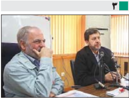
مشارکت شهرداری و دوب آهن در ساخت آبریزها و آبسازه‌ها