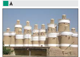
با همکاری شهرداری زیباشهر برج کیوتو در قزو ثبت جهانی خواهد شد