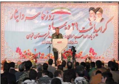
روزنامه‌های «روزنامه‌های ایران» و «روزنامه‌های تهران» در مراسم روز حماسه و ایثار