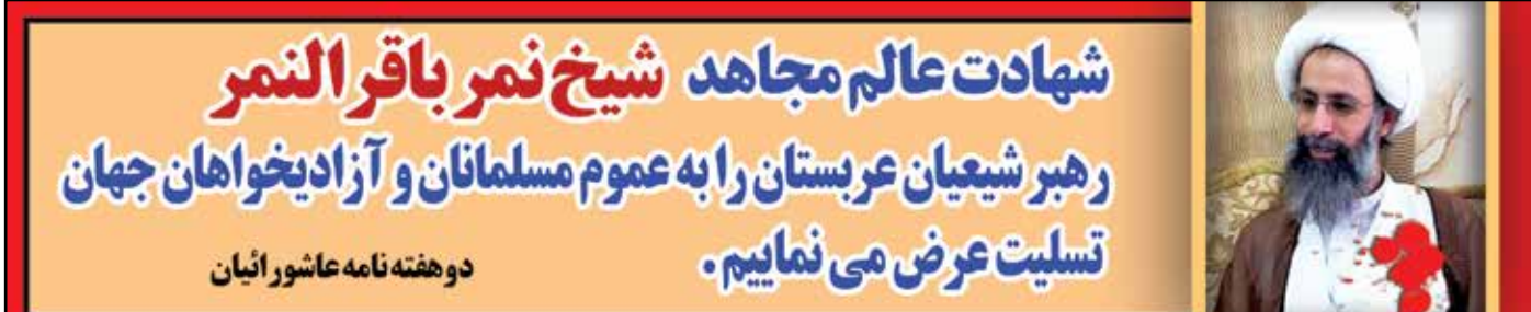
دوهفته نامه عاشورائیان

عمار در صف اول مبارزه با فساد بخشیدن خمس آفریقا به مروان، ساخت خانه های مجلل برای خود، همسرش نائله و نزدیکان، انتصابات فامیلی، فساد مالی اطرافیان و دولتی ها بخشی از حیف و میل بیت المال توسط خلیفه امیرمومنان بود.