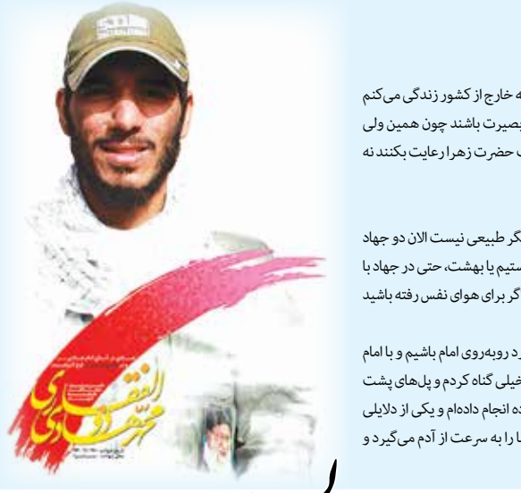
که خارج از کشور زندگی می کند یا بصیرت باشند چون همین ولی لب حضرت زهرا رعایت بکنند نه دیگر طبیعی نیست الان دو جهاد هستیم یا بهشت، حتی در جهاد با و اگر برای هوای نفس رفته باشید دارد رویه روی امام باشیم و یا امام خلیف گناه کرد و پلهای پشت نود انجام داده ام و یکی از دلایلی ها را به سرعت از آدم می گرد و