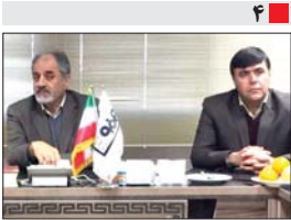
مدیر عامل فولاد مبارکه: انجام پروژه های عمرانی یکی از رسالت های اجتماعی فولاد مبارکه است