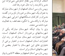
ریس بازرسی استان اصفهان و منطقه ۶ کشور به بیان...