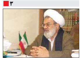
امام جمعه خمینی شهر: دشمن یا تحقیر خمینی شهر به دنبال تضعیف نظام خمینی (ره) است