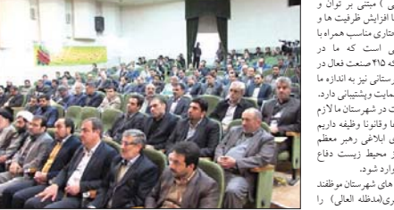
ریس بازرسی استان اصفهان و منطقه ۶ کشور به بیان...