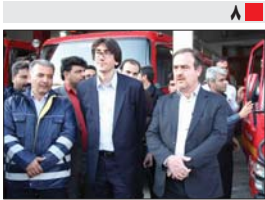
شهردار مبارکه در بازدید از مرکز مدیریت بحران شهرداری مبارکه: وظیفه شهرداری ارائه خدمات مطلوب به مردم است