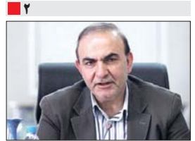
معاون شهرسازی و معماری شهرداری اصفهان خیر داد: 'شهرداری الکترونیک' در سال ۹۵ محقق می شود