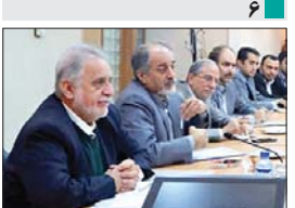
سرمایه گذاری ایتالیا برای تولید ورق لوله های بدون درز در ایران

عقدائی معاون سیاسی، امنیتی استاندار در همایش حضور حداکثری انتخابات ۹۴: