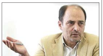
نایب رئیس فدراسیون فوتبال کشورمان گفت: خدمت صدور ویزا شیطنت آمریکایی است.