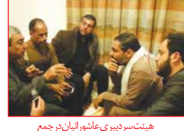
هیئت سردبیری عاشورائیان در جمع رزمندگان تیپ حبیب بن مظاهر در عراق

تلفنی به مسئولین سفارش مردم ناتوان را می‌کرد. وقتی که مرجعیت شیعه «حضرت آیت الله سیستانی» واجب کردند که مردم به جبهه بروند و بر علیه داعش بجنگند، در همان روز اول خودش و دوستانش به سامرا رفتند. داعشی‌ها تا یک کیلومتری حرم امام حسن عسکری (ع) نزدیک شده بودند. آیت الله سیستانی در روز جمعه فتوا دادند - ایشان روز شنبه به سامرا رفتند با صدام و صدایمان در همین بین الحرمین جنگید - بعد از سقوط صدام با آمریکائیه هم جنگید. آمریکایی‌ها او را در بصره زندانی کردند، تا ۳ سال هیچ کس از او هیچ اطلاعی نداشت. تمام نیروها و دفاتر مراجع تقلید پیگیر شدند ولی خبری از ایشان نبود. بعد از ۳ سال او را آزاد کردند. بعد از آن رفت در حرم امام حسین (ع) و آنجا مشغول کار شد و عضو اطلاعات حرم شد. در مواقع حمله به جنگ می‌رفت و وقتی که جنگ نبود به حرم برمی‌گشت و فی سبیل الله خدمت به زوار امام حسین (ع) می‌کرد. از طرف وزارت کشور به او درجه دادند. او قبول نکرد و گفت من به دستور مرجعیت شیعه به جنگ می‌روم. در جنگ فرمانده دسته آریچی زن‌ها بود. در جوف الصخر مردانه جنگید. اطراف قیور طفلان مسلم دلیرانه جنگید. دوساعت جنگید و آن محله را از