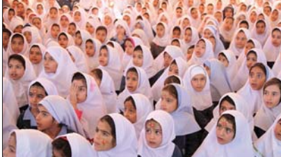
فرهنگی بین ما و مردم جدایی افتاده است. با کارهای فرهنگی ما مردم به فراموشی سپرده شده است. شهرداری مبارک در پی آنست که با برگزاری برنامه های متنوع و جذاب، مردم را به فرهنگ بازگرداند.