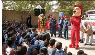
فرهنگی بین ما و مردم جدایی افتاده است. با کارهای فرهنگی ما مردم به فراموشی سپرده شده است. شهرداری مبارک در پی آنست که با برگزاری برنامه های متنوع و جذاب، مردم را به فرهنگ بازگرداند.

توجه ویژه شهرداری مبارک به فرهنگ شهروندی و نشاط اجتماعی شهردار مبارک در این راستا تاکید کرد: «فرهنگ شهروندی و نشاط اجتماعی، دو پایه اصلی توسعه و پیشرفت هر جامعه است. ما باید به این دو پایه توجه ویژه داشته باشیم. شهرداری مبارک با برگزاری برنامه های متنوع و جذاب، مردم را به فرهنگ بازگرداند.»