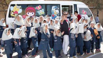
فرهنگی بین ما و مردم جدایی افتاده است. با کارهای فرهنگی ما مردم به فراموشی سپرده شده است. شهرداری مبارک در پی آنست که با برگزاری برنامه های متنوع و جذاب، مردم را به فرهنگ بازگرداند.

توجه ویژه شهرداری مبارک به فرهنگ شهروندی و نشاط اجتماعی شهردار مبارک در این راستا تاکید کرد: «فرهنگ شهروندی و نشاط اجتماعی، دو پایه اصلی توسعه و پیشرفت هر جامعه است. ما باید به این دو پایه توجه ویژه داشته باشیم. شهرداری مبارک با برگزاری برنامه های متنوع و جذاب، مردم را به فرهنگ بازگرداند.»