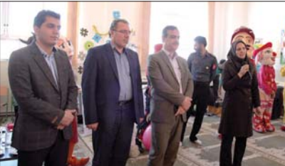
فرهنگی بین ما و مردم جدایی افتاده است. با کارهای فرهنگی ما مردم به فراموشی سپرده شده است. شهرداری مبارک در پی آنست که با برگزاری برنامه های متنوع و جذاب، مردم را به فرهنگ بازگرداند.

اما در شهرها و شهرستانها، نهادی که بتواند با امکانات سخت افزاری، نرم افزاری و مالی در راستای آموزش های شهروندی و ایجاد نشاط اجتماعی حرکت کند، وجود ندارد. این تلاشها باید در کنار فعالیت های مردمی و اجتماعی صورت گیرد. شهردار مبارک در این راستا تاکید کرد: «فرهنگ شهروندی و نشاط اجتماعی، دو پایه اصلی توسعه و پیشرفت هر جامعه است. ما باید به این دو پایه توجه ویژه داشته باشیم. شهرداری مبارک با برگزاری برنامه های متنوع و جذاب، مردم را به فرهنگ بازگرداند.»