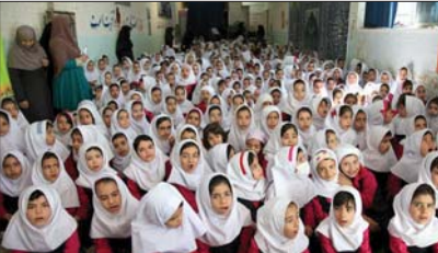
فرهنگی بین ما و مردم جدایی افتاده است. با کارهای فرهنگی ما مردم به فراموشی سپرده شده است. شهرداری مبارک در پی آنست که با برگزاری برنامه های متنوع و جذاب، مردم را به فرهنگ بازگرداند.

توجه ویژه شهرداری مبارک به فرهنگ شهروندی و نشاط اجتماعی شهردار مبارک در این راستا تاکید کرد: «فرهنگ شهروندی و نشاط اجتماعی، دو پایه اصلی توسعه و پیشرفت هر جامعه است. ما باید به این دو پایه توجه ویژه داشته باشیم. شهرداری مبارک با برگزاری برنامه های متنوع و جذاب، مردم را به فرهنگ بازگرداند.»