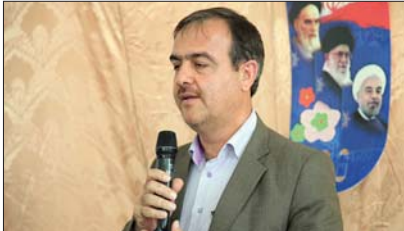
فرهنگی بین ما و مردم جدایی افتاده است. با کارهای فرهنگی ما مردم به فراموشی سپرده شده است. شهرداری مبارک در پی آنست که با برگزاری برنامه های متنوع و جذاب، مردم را به فرهنگ بازگرداند.

توجه ویژه شهرداری مبارک به فرهنگ شهروندی و نشاط اجتماعی شهردار مبارک در این راستا تاکید کرد: «فرهنگ شهروندی و نشاط اجتماعی، دو پایه اصلی توسعه و پیشرفت هر جامعه است. ما باید به این دو پایه توجه ویژه داشته باشیم. شهرداری مبارک با برگزاری برنامه های متنوع و جذاب، مردم را به فرهنگ بازگرداند.»