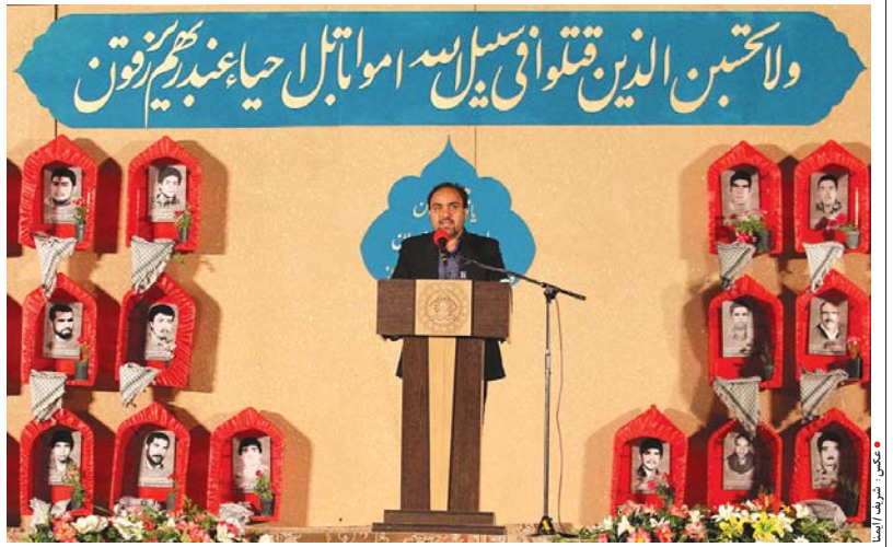
یازدهمین یادواره سرداران و ۱۲۲ شهید سرفراز شهر دیزبچه برگزار شد ۴

شهردار اصفهان با اشاره به ورود شهر اصفهان به شهرهای دوستدار کودک گفت: در حال حاضر برنامه ریزی های لازم برای ایجاد زیرساخت های شهر دوستدار کودک در دستور کار است. به گزارش اداره ارتباطات رسانه ای شهرداری اصفهان، دکتر مهدی جمالی زاد در حاشیه مراسم بازگشایی مدارس و زنگ مقاومت در جمع خبرنگاران به ورود شهر اصفهان به شهرهای دوستدار کودک اشاره و اظهار داشت: شهرداری اصفهان در بخش های مختلف فرهنگی، اجتماعی و عمرانی ایجاد زیرساخت های شهر دوستدار کودک را اجرایی خواهد کرد. وی افزود: در حال حاضر شهرداران در مناطق مختلف شهر اصفهان اجرای این طرح را آغاز کرده اند. شهردار اصفهان در ادامه اجرای طرح های زیمناسازی اطراف مدارس اصفهان توسط شهرداران مناطق را نیز از اقدامات شهرداری برای بازگشایی مدارس عنوان کرد و افزود: مسأله سلامت محیط مدارس و حفظ کثی خیان های سطح شهر نیز برای تردد راحت دانش آموزان اجرایی شده است. وی همچنین به راهاندازی کمپین فرهنگ ترافیک در شهرداری اصفهان اشاره و بیان داشت: کودکان محور اجرای این طرح خواهند بود چرا که به دنبال آن در نظر داریم اجرای شهر بدون خودرو را نیز در دستور کار قرار دهیم. جمالی زاد راهاندازی اتوبوس دانش آموزی را از دیگر اقدامات شهرداری اصفهان برای اجرای پروژه مهر اعلام کرد و افزود: این طرح از امروز و با استفاده از ظرفیت هشت اتوبوس برای ۱۴ مدرسه شهرداری اصفهان در حال اجرایی شدن است. وی همچنین در خصوص اجرای طرح های ترافیک در محدوده مرکزی شهر اصفهان نیز گفت: همانطور که اعلام شد اتفاقات تلاشی در راه است و برای هسته مرکزی شهر اقداماتی همچون ایجاد بکچ غیربومی با راه اندازی هتل جهان نما و توسعه ساختمان تجاری و غیربومی جهان نما را پیگیر هستیم.