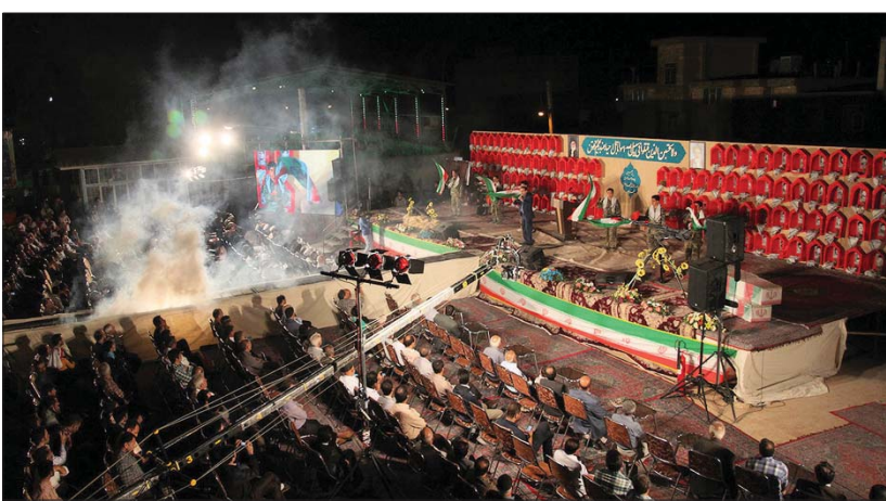
افزون بر آژاد شورای اسلامی و خیرت و پایسردی که شهردار در برگزاری بروز می دهند همین خواست و آژاد شهردان، بسیجیان، زرمندان، ایثارگران و خانواده های شهر دیزچه است. این مطالبه و می کنید؟ و لاجرم یکی از موفقه های مهم در رایجایی به شورا همین موضوع ساماندهی گزاره های شهدا، باور و نس ایجاد است. است. به همین اعتبار هم در هنگام انتخاب شهرداری که از شرط قابل درک و حتی ارزشمند است، شوری اسلامی را شهرداری که در آستانه انتخاب قرار دارد موضوع برگزاری باشکوه یادواره شهدا و محلات است از سوی دیگر شوری اسلامی نیز به شکلی عقلانی دست شهردار را در باشکوهتر برگزار کردن یادواره باز می گذارد. ضمیر هم نمی کند چون شهرت نظیر نمی کند به وجه الله، و اگر نیت شورا و شهردار خالصانه باشد بقینا توره این دنیا و آخرت را تأمین کرده اند.

شهابی گفت رایج شهردار دیزچه در نشست خبری که به مناسبت برگزاری یازدهمین یادواره سرداران و ۱۲۲ شهید شهر دیزچه برگزار شد با بیان این که شهدا نیازمند درگاه تلاش شده هر سال یادواره برگزاری یادواره شهدا به منظور شناسایی و آموزش سیره زندگی شهدا به نسل جوان انقلاب است چرا که وظیفه ما شناسایی و آگاهی نسل سوم و چهارم انقلاب با شهدا و دستاوردهای نظام و انقلاب است. شهردار دیزچه با تأکید بر این که باید فرهنگ ایثار و شهادت را به نسل جوان آموزش داد، خاطر نشان کرد تلاش شده هر سال یادواره همین راستا به دنبال ارائه خردی فرهنگی از آنها هستیم، در یادواره اسامی آژاد سرافراز مهین طباطبائی و مادر شهید خرازی و همچنین تعدادی از مسئولان استانی حضور پیدا خواهند کرد، پیش از ۳ هزار یازدهم در دوران دفاع مقدس از شهر دیزچه بودند و این شهر ۶ آژاد و نفر جانباز بالای ۷۰ درصد دارد. وی ادامه داد، عنوان یادواره سال گذشته ۱۰۷ شهید شهرستان دیزچه بود چرا که آمار مشخصی از تعداد خانواده شهدا که از شهر دیزچه مهاجرت کرده بودند، نامشخص اما یادواره اسامی برای ۱۲۲ شهید برگزار خواهد شد، در کنار آن یادواره ۶۰۰ شهید مبارکه و ۱۷ شهید سیماں خواهد بود نیز برگزار می شود. تأیید با بیان این که یادواره ۱۲۲ شهید دیزچه و ۶۰۰ شهید شهرستان مبارکه در جوار آستانه مقدس امامزاده شاه سلیمان این شهر برگزار خواهد شد، اظهار کرد یادواره ۱۲۲ شهید دیزچه روز پنجشنبه ۲۶ شهریور بعد از نماز مغرب و عشاء برگزار می شود و در جریان این مراسم از خانواده شهدا تجلیل به عمل می آید.