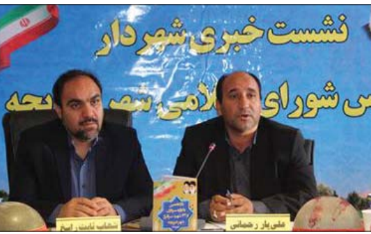
کلیشه در صفحه مقابل