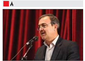
شهردار مبارکه وابستگی شدید شهرستان به درآمد های ارزش افزوده