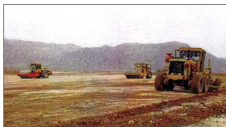
عملیات خاک برداری شرکت های حمل و نقل زرین شهر توسط شرکت زرین سپاهان