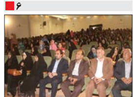
۶ جشن میلاد حضرت معصومه(س) و روز دختر در فرهنگسرای بهمن شهرداری چیه برگزار شد