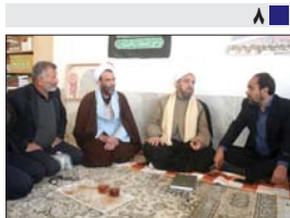
حضور شهردار شهر دیزبچه در جمع مردم نکوآباد و حسن آباد