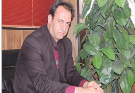
عضای هیأت علمی، تخصص و مرتبه علمی مناسب آنان، رشته های مورد نیاز در واحد تعداد دانشجویان و اعضای هیأت علمی در حال حاضر از وضعیت ایده آلی برخوردار می باشد. این واحد در حال حاضر دارای ۵۲ رشته کارشناسی است و پیش از ۱۰ رشته جدید نیز در مراحل نهایی فرآیند دارد.