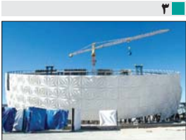
۳ صخره نوردان پوسته سالن اصلی مرکز همایش ها را نصب می کنند