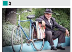
۵ دنیا را برای لحظه ای بدون تو نمی خواهم پدر

سیحانی ، مدیرعامل فولاد مبارکه در جمع خبرنگاران مطرح کرد: