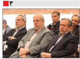
وزیر نیرو در مراسم افتتاح پروژه برق منطقه‌ای اصفهان. پاییز امسال تولید سوم کوهرنگ به بهره‌برداری می‌رسد