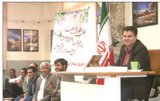
گزارش تصویری مراسم تجلیل از کارکنان شهرداری زیباشهر