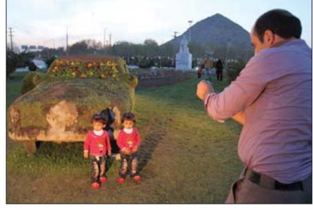
بازدید کنندگان از عملکرد شهرداری ابراز رضایت کرده اند. دستگاها، فرهنگی و هنری در شهر فراهم شود.