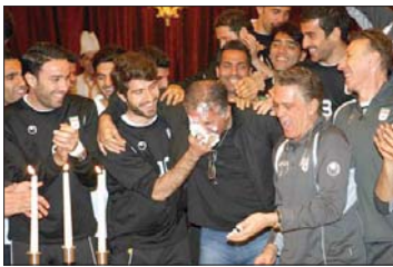
صورت سرمربی تیم ملی آن هم در دست گرفته بود، کی روش را حسابی غافلگیر کرد.

ملی پوشان فوتبال کشورمان پس از شکست کویت، این پیروزی را به همراه جشن تولد کارلوس کی روش جشن گرفتند. به گزارش ایسنا، تیم ملی فوتبال کشورمان امروز با گلزنی یعقوب کریمی و گل پیروزی بخش کریم انصاری فرد، ۳ بر ۲ از سد کویت گذشت تا بدون شکست راهی جام ملت‌های آسیا ۲۰۱۵ استرالیا شود. بازیکنان و اعضای تیم ملی کشورمان پس از بازگشت به هتل آزادی تهران جشن تولدی برای کارلوس کی روش ترتیب دادند که هرچند کی روش پیش از رسیدن به هتل از آن خبردار شده بود اما انصاری فرد از زدن تکه‌ای از کیک تولد به