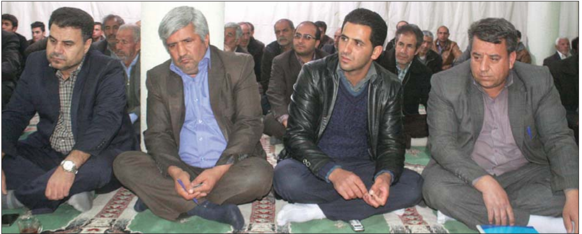
میزبانان اولین نشست مشترک شهردار، شورای اسلامی و شهروندان فییم زیباشهر در شهرستان آدرگان با حضور انبوه شهروندان، علمای و فرهنگیان برگزار شد.

در این جلسه، شهردار و اعضای شورای اسلامی شهر پس از اقامه نماز جماعت مغرب و عشاء به پرسش های شهروندان و نمازگزاران در زمینه های فرهنگی، خدماتی، درمانی، عمرانی و اجتماعی پاسخ دادند.