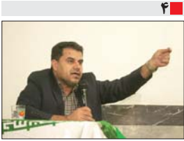
شهردار زیبانشهر در نشست با شهروندان در آذرگان مطرح کرد زیبانشهر متحول خواهد شد